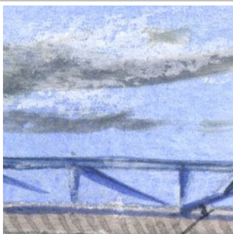
1、雲は最後に白のパステルで描きました その後「ブルー・グレー」で影をつけています