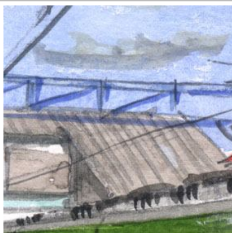
2、跨線橋が地方駅の重要な部品です 架線もしつこくなくに入れておきます