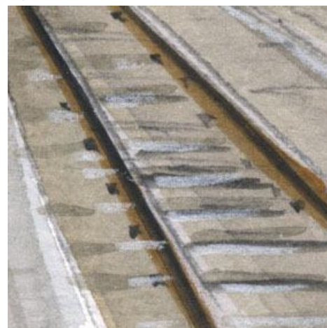
6、線路は難しいです 「立体感」と「適度な高さ」を表現しないと 失敗です