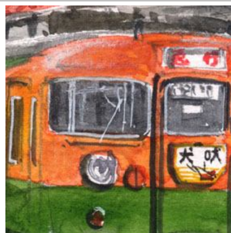
3、先頭車の前面が一番気を使います 人間の顔と同じです 「おでこ」の「てかり」が重要