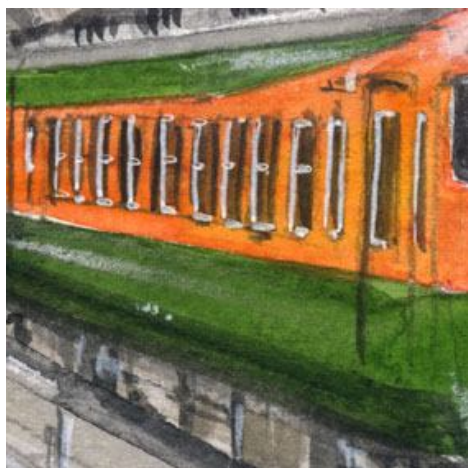
4、ズラリと窓が並んでいるところが 急行列車らしい雰囲気を出します