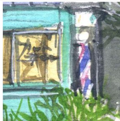
3、床屋さんの壁と窓 回転看板は描いたほうが良いのですが これだけ丁寧にならないように注意します