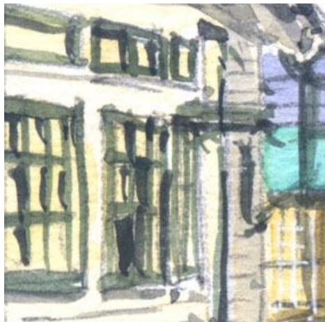
4、手前の商店の明るい壁 レモン・イエローに少しだけジョン・ブリアン(肌色)を混ぜています