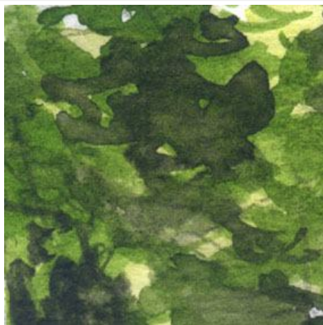
1、樹木の緑は パーマネント・グリーン サップ・グリーン シャドウ・グリーンを重ねます