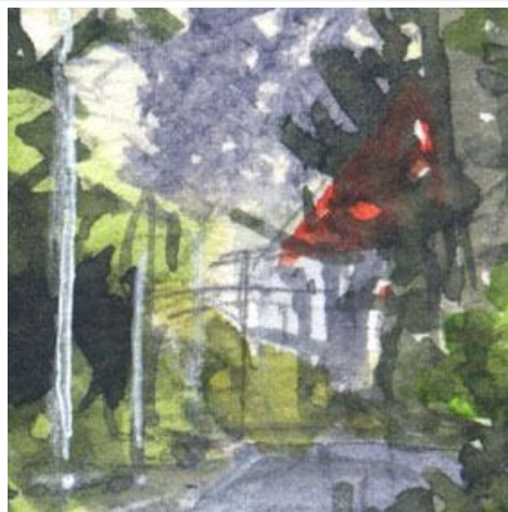
2、道の「遠く」の部分が難しいです 木々の間を抜けて 明るい感じにしたかったのですが やや失敗