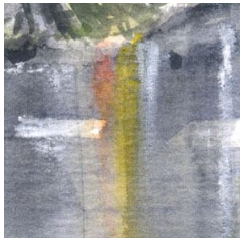
5、雨にぬれた路面への反映 一番上に絵の具を置いて 乾かないうちに 平筆で下に曳きます