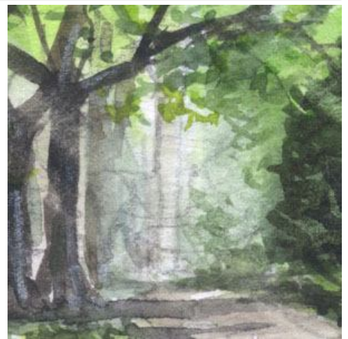
3、森の奥に木がない場所(広場)があるとそこだけ明るく見えます こういう場所は「期待感」のようなものを感じます