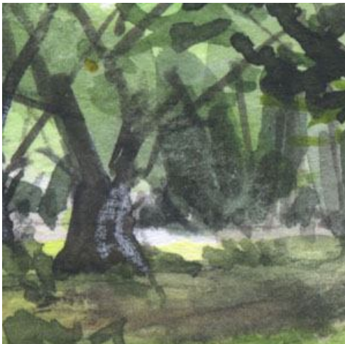
4、森の奥は暗く シャドウグリーンが便利ですがうまく置かないと「心霊写真」になってしまいます