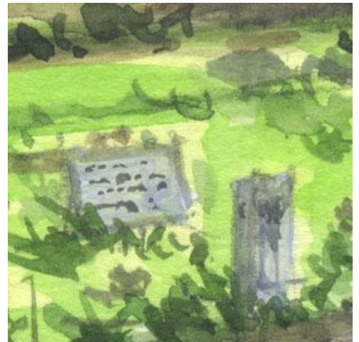
6、道しるべや説明板...これは省略しても良かったでしょう