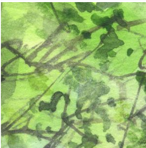
1、レモンイエロー→リーフグリーン→サップグリーンの順に重ねています