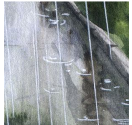
6、縁石近くの水たまりが 目下研究課題です