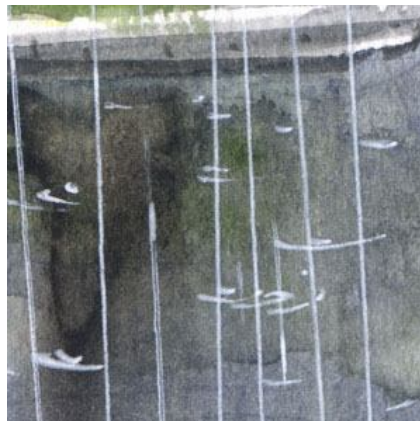
5、路面の反映が一番重要です 雨粒の波紋も描くといいいでしょう