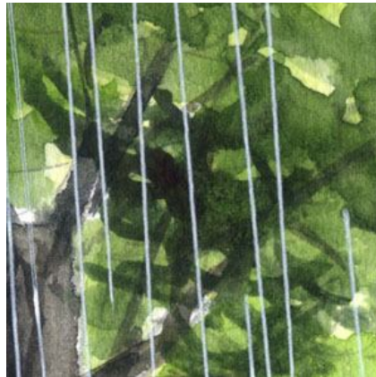
2、特に暗く見える場所には 迷わず「シャドウグリーン」を置きます