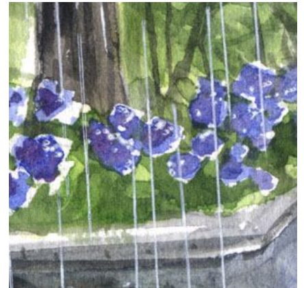
3、紫陽花の「房」は 白い部分を残すのがコツです