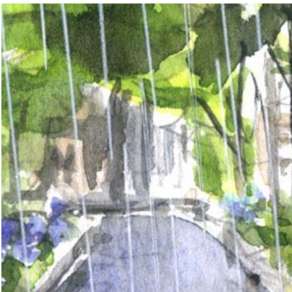
4、遠くの建物は 適度に省略すること