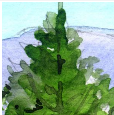
2、針葉樹はもっと立体感が欲しかったです