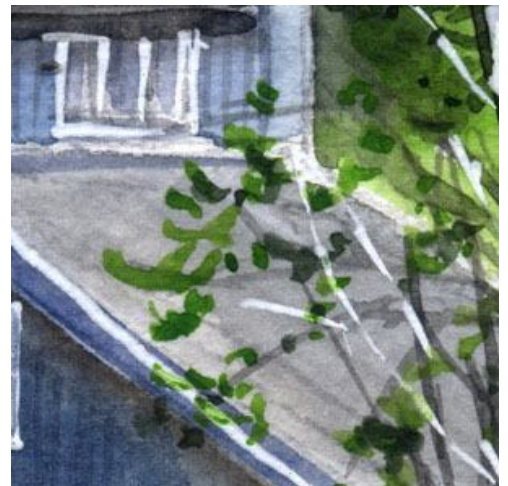
6、建物の手前の新緑も大切です