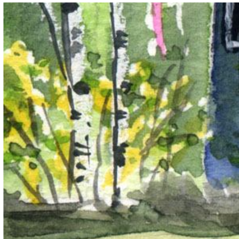
5、レンギョウの黄色で「春らしさ」を強調