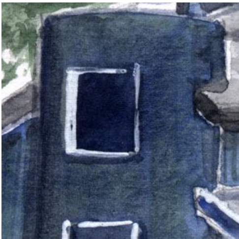
4、円筒状の構造物の立体感が難しい