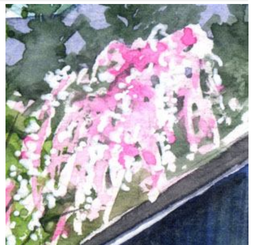
3、枝垂桜はマスキングを使いました