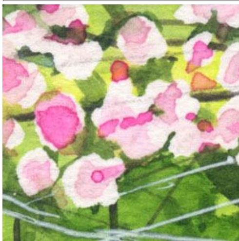
1、八重桜は マスキングを多用しました