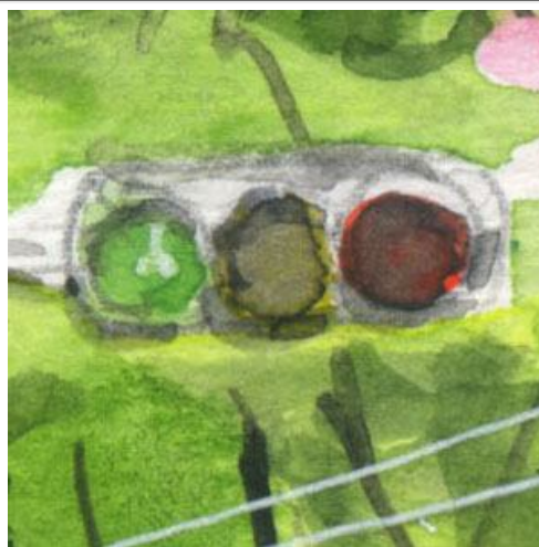
2、信号機の表現は 非常に難しい