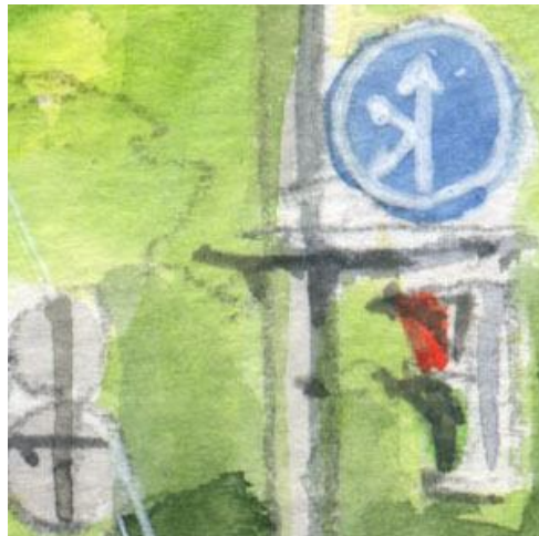
5、横向きの歩行者用信号が難しい