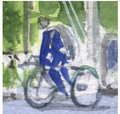
6、自転車の人物は 研究中です