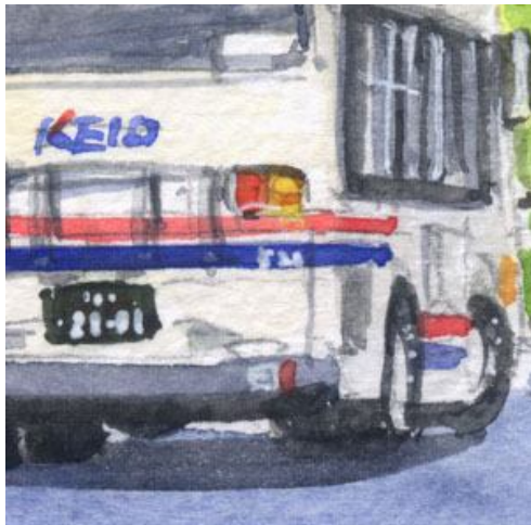
4、京王バスは その特徴をしっかりと