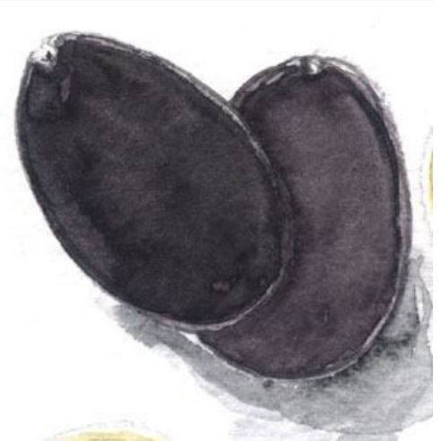
3、黒に紫を混ぜています 質感が難しい