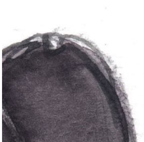
4、先端部の細かいところを よく観察