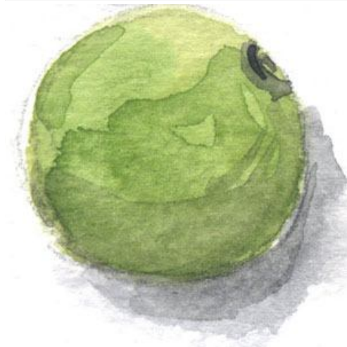
1、緑に少し黒を混ぜています