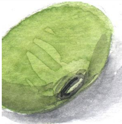
2、同じ色を何度か重ねて 立体感を出します