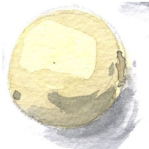
5、大豆は色味が少ないので 難しい