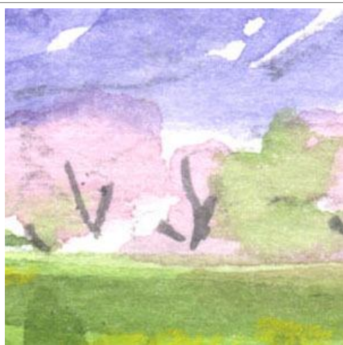
3、遠くの山桜 濃くしすぎないように