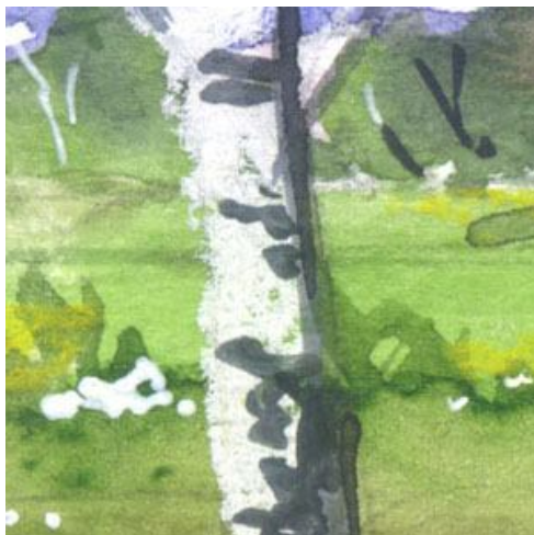
5、白樺の幹には 白のパステルを使用