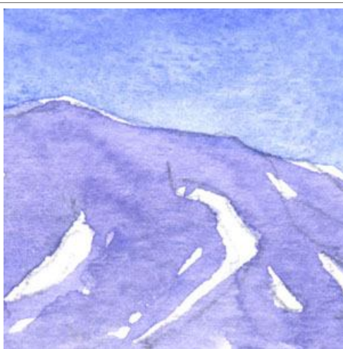
2、空と浅間の色は微妙にちがいます