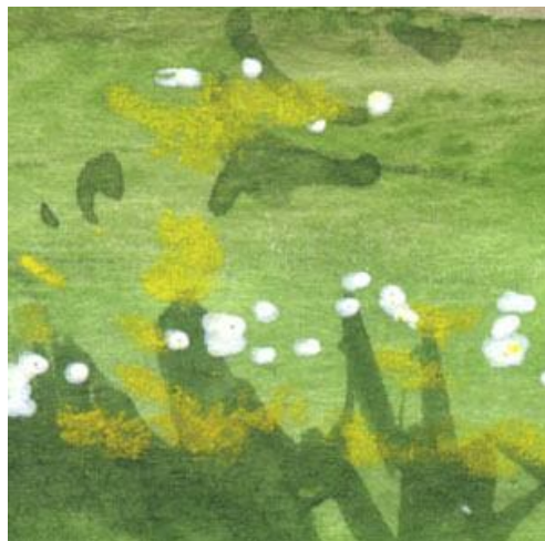
6、黄色と白の花を散りばめました