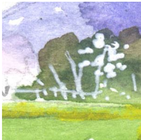
4、白い花は「コブシ」をイメージしました