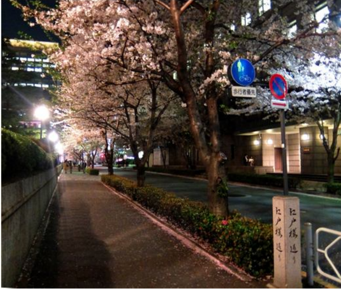
その名も「江戸桜通り」日銀の裏の夜桜の名所だ。

私の自転車通勤経路は、江戸の街を南北に縦断するようなコースになっている。今の時期は、夜桜が美しいのも嬉しい。