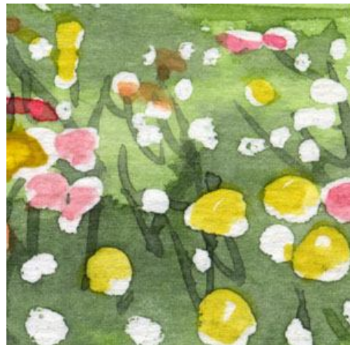
6、塗らずに白いままの花も残しましょう