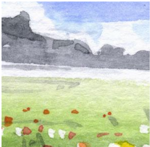
4、遠くの草原は 少し霞む感じに