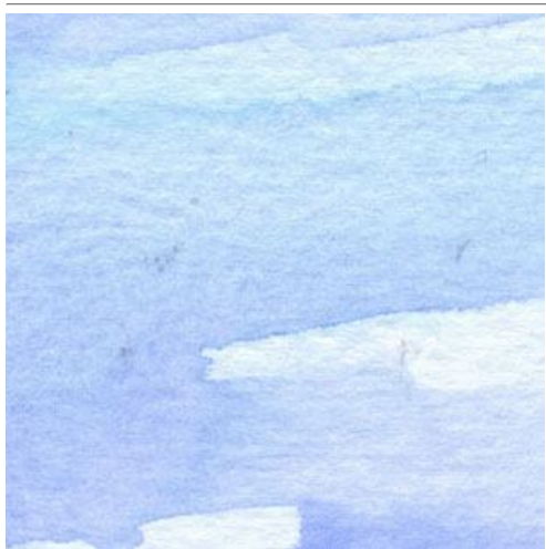
1、空は意識的に塗る残しをつくります