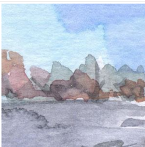
2、岬上の樹木 ほんの少し春色を