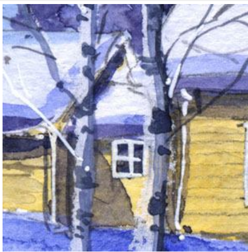
2、建物の手前の幹が難しいです