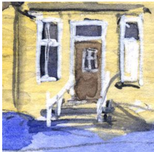
4、階段の手すりや窓枠は 細いホワイトで