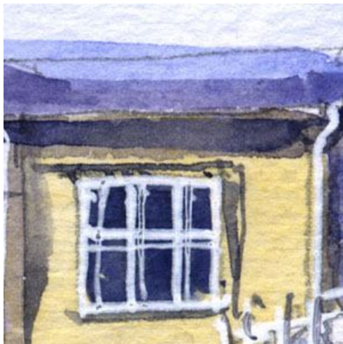
5、屋根の雪の縁は 青紫色の影で