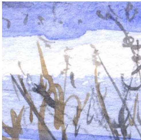
6、雪の上の枯草も大切な「部品」