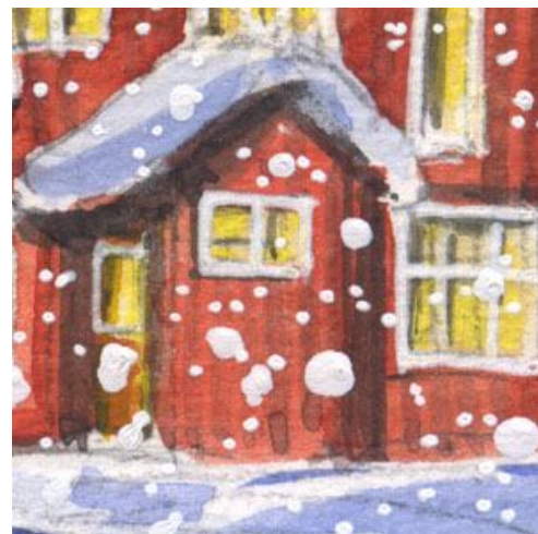
6、こういう立体的な構造物が難しい