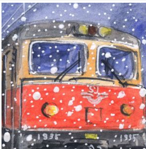
2、日本のものと違い 列車の顔が難しい