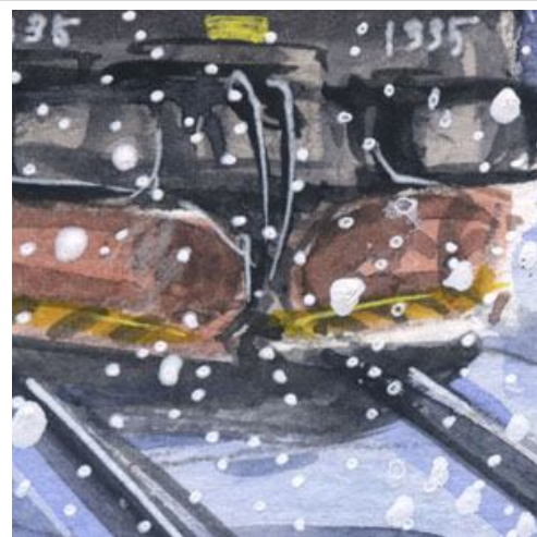
3、除雪版は重要 線路はくっきりと