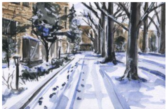
6、樹木に雪をのせます 雪の上の足跡も大切です