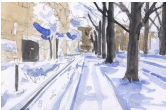
3、樹木(イチョウ)をガン!と塗ります 思い切りが必要です