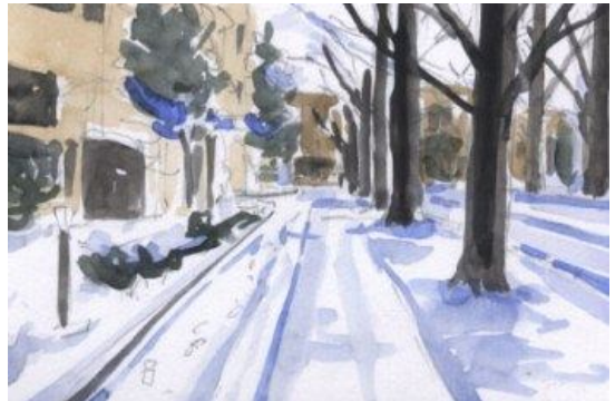
4、あとは少しずつ色をのせてゆきます