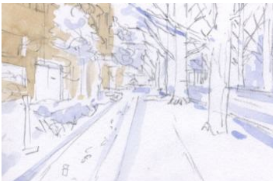
2、まず建物や雪の影を薄く塗ります 全体に色を置きます