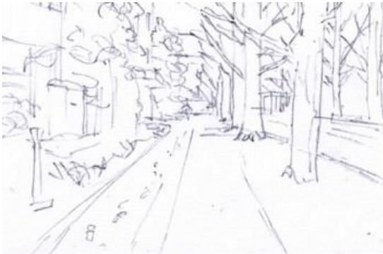
1、下絵は鉛筆で薄く描きます (実物をもっと薄いです)