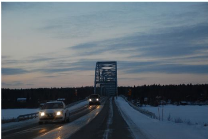
ルーレオに近づき、やっと夜が明けてきました。これはルーレオ川の橋梁です。