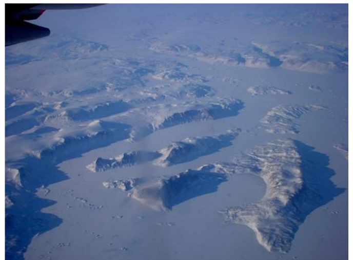
「恐ろしいほど美しい グリーンランドのフィヨルド」

同行の友人も夢中で撮影していた。めったにない体験ができ、良い教材写真も残すことができた。