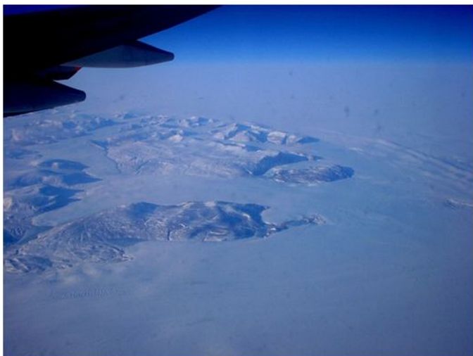
「北極海からグリーンランドにさしかかったところ」

日本から航空機でグリーンランドに行くには、最低でも2回の乗り換えが必要で、便数も少ない。しかし、この便では「無料オプション」でグリーンランド上空の遊覧飛行を楽しむことができた。