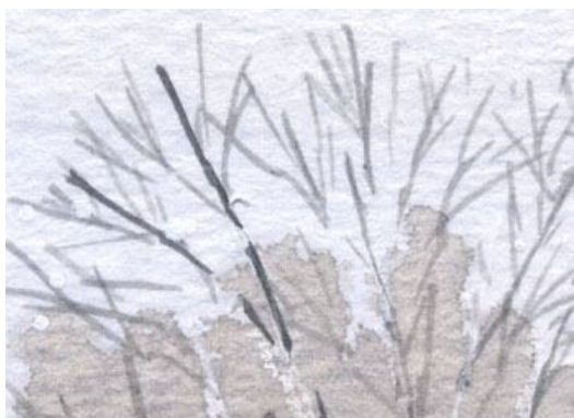
3、白樺の梢の表現が難しいです 細く薄い色の線描