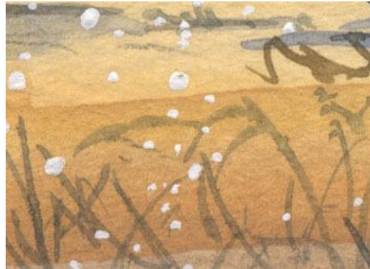
6、枯野の基本色は ジョンブリアン(肌色)の濃淡です