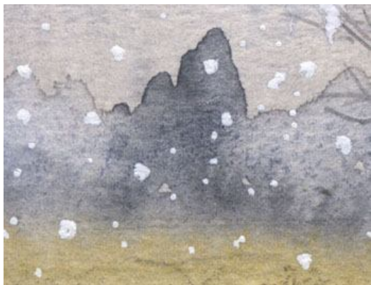
2、近くの森は 彩度も輪郭もやや強く