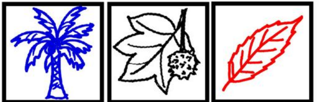
大温室 フウ (ゴヤキ)

子どもたちが持つスタンプカードは、ラジオ体操の出席カードのように、首からさげて持ち歩く。全部押し終るとこんな感じになる。どの子も結構楽しみにしていたような・・・のだが!