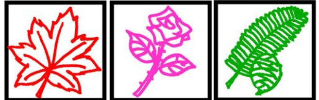
モミジ山 バラ園 メタセコイア