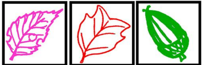
サクラ園 シナクリノキ ドングリ