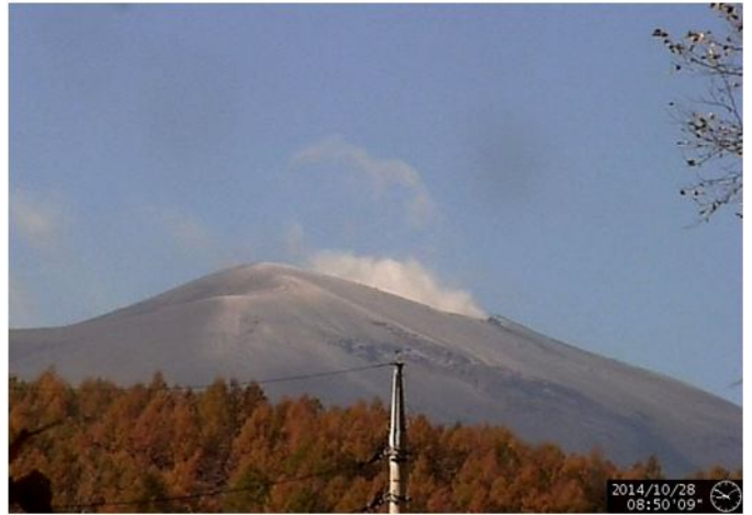
「昨年の初冠雪」 10 月 28 日だったので、まだカラマツの紅葉が美しい時期だった。

北軽井沢は今朝雨だったそうだが、山頂付近は、北軽井沢よりも 10°C 近く気温が低いので、雪になったのだ。例年、浅間山の初冠雪は 10 月下旬なので、今年は半月以上遅れての初冠雪になった。