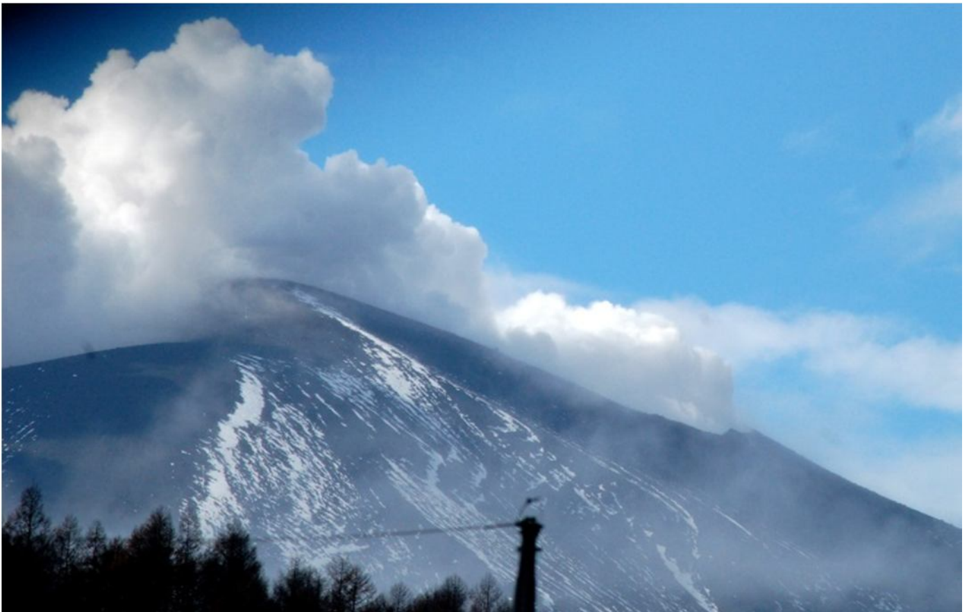
(下) 「浅間山初冠雪」 2015, 11, 15 / 10:30AM

現地には、自動撮影のデジタル一眼レフカメラも設置してある。このカメラも、今朝の初冠雪をとらえていた。ネットワークカメラよりも、はるかに高解像度の画像を得られる。この写真 (下) は、明日の「上毛新聞朝刊」に掲載される予定だ。