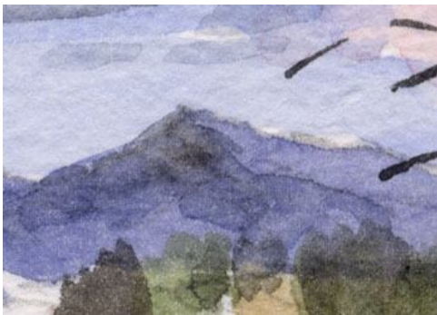
2、主題の笠山 青紫に更に濃い紫を重ねます