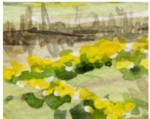
5、黄色い花の連なり 根元にはシャドウグリーンで影をつけます