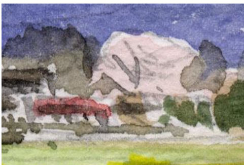
3、遠くの桜と民家 民家を故意に詳しく描かないように