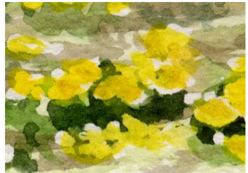
6、黄色も二種類を重ねます