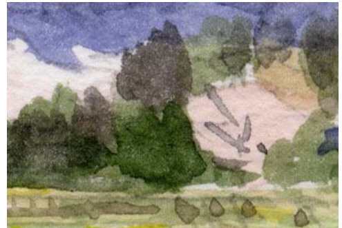
4、桜と針葉樹の重なり 針葉樹は緑ばかりではありません