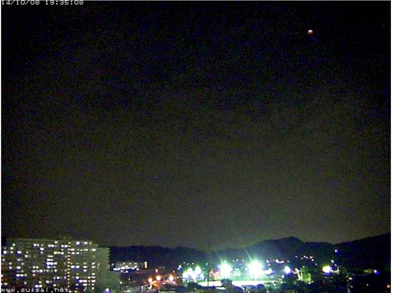
「小川町の夜景と皆既中の満月」

月食当日は午後から曇ってしまい、心配していました。幸い生中継カメラがある、埼玉県の小川町は「快晴」とはいかないまでも、晴れ間もあって、月がよく見えました。東京からも遠隔操作をして撮影することができました。今回はその写真を掲載します。