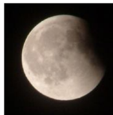
少し欠けている満月