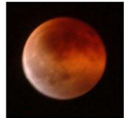
皆既月食中の満月