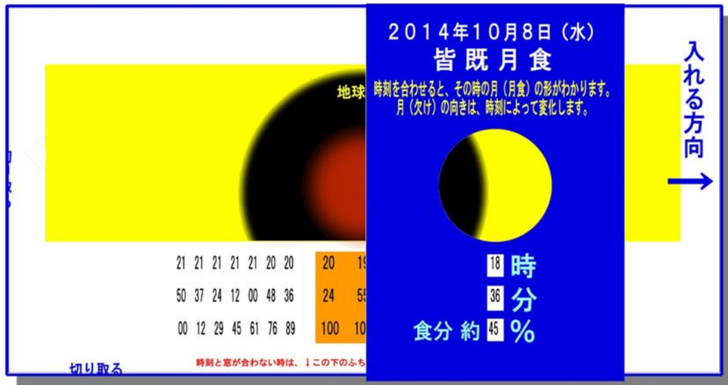
「皆既月食早見盤」 制作 ; C. Tanaka 2014, 10

* 型紙は 2 ページ目にあります。画用紙 (8 才か 9 才) に印刷します。モノクロでも OK です。